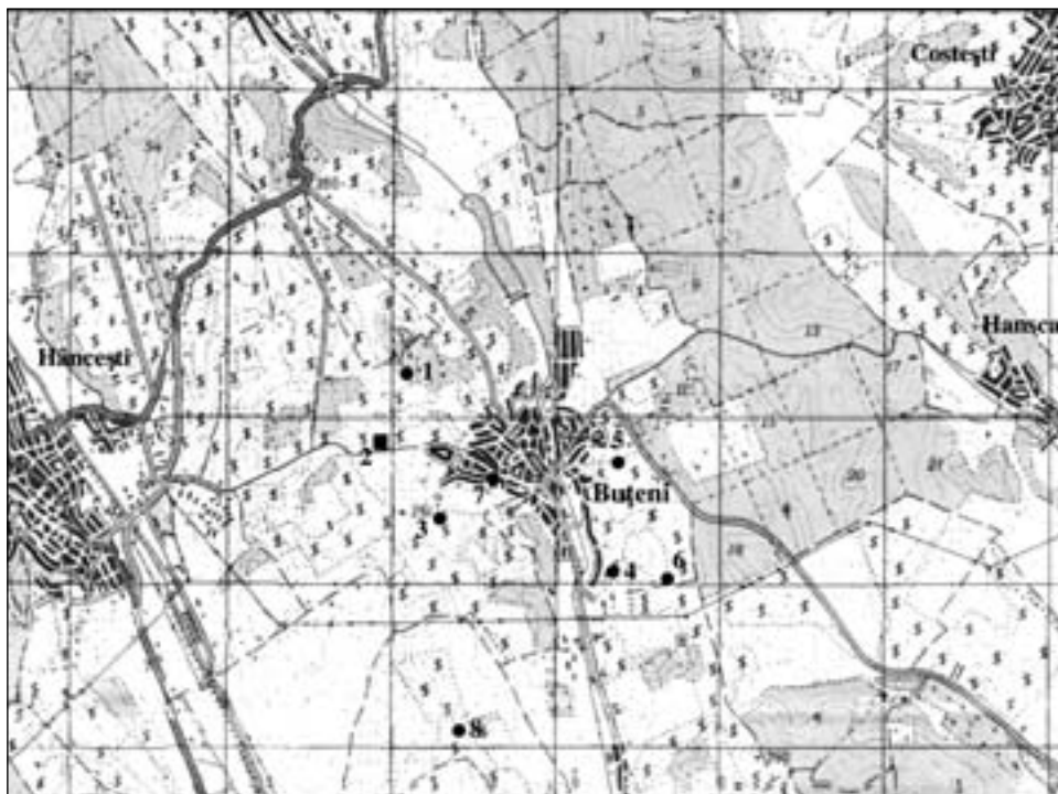
Fig. 1. Descoperiri arheologice în apropierea s. Buțeni (r-nul Hâncești).

în mod deosebit fragmentele de amfore grecești și de ceramică de lux. În ruptura malului și astăzi se observă anumite complexe, gropi menajere, gropi de gunoi sau gropi de la construcțiile de tip bordei adâncite în sol. Spre direcția de sud-sud-est, la aproximativ 1,2 km, platoul se învecinează cu o depresiune. Pe panta de nord-nord-vest a acesteia se întinde o altă așezare pe o suprafață de aproximativ 0,1 ha. Pe centrul ei crește un nuc bătrân. Pe panta ușor înclinată spre sud au fost semnalate mai multe vestigii din epoca timpurie a evului mediu. Pe fundul depresiunii și astăzi se